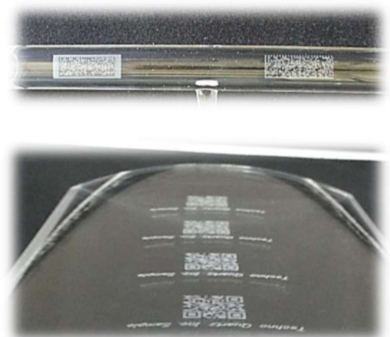
石英ガラス管への内部マーキング Direct marking inside Quartz tube